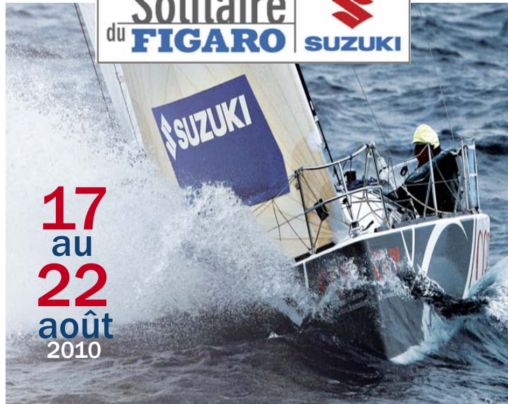
Crédit photos : JM Enault, Marmara Vaïeron, Le Figaro, DR Impression Ville de Cherbourg-Octeville